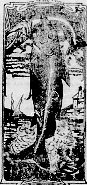
La última palabra

Emulsión "Dos pescados" (Marca registrada.)