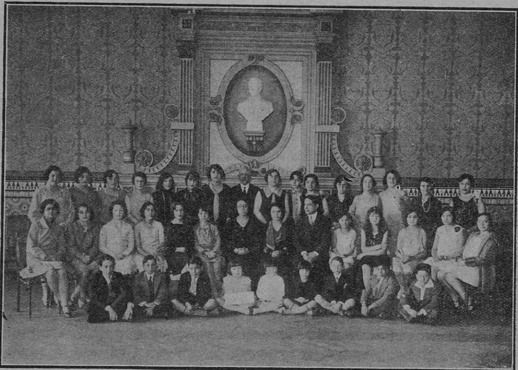
PROFESORES Y ALUMNOS DEL INSTITUTO CULTURAL