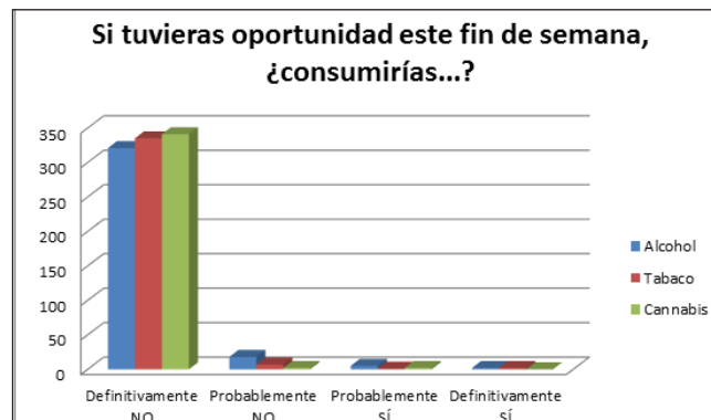
Figura 3. Actitud general ante el consumo de alcohol, tabaco y cannabis.