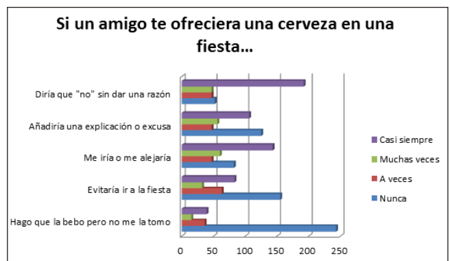
Figura 6. Estrategias de rechazo al ofrecimiento de alcohol en una situación concreta.

Los resultados indican que el patrón de uso de las estrategias se adapta al tipo de situación. Tal y como se muestra en la Gráfica 6, cuando a los adolescentes se les presenta la situación hipotética concreta de una fiesta en la que un amigo les ofrece una cerveza, las estrategias más utilizadas por los adolescentes son decir "no" sin dar explicaciones (84,6%), irse o alejarse sin tomar la cerveza (75,3%) y decir "no" añadiendo una explicación o una excusa (62,6%). La estrategia que supone anticipar la situación y, por tanto, evitar ir a la fiesta es utilizada solo en la mitad de los casos (53,5%) y la estrategia de fingir que beben la cerveza solo sería utilizada por el 27% de los adolescentes. Únicamente se han encontrado diferencias de género en el uso de la estrategia de fingir tomarse la bebida ( t = 2,575, p = ,010 ), siendo los chicos los que informaron de llegar a utilizarla con mayor frecuencia que las chicas.