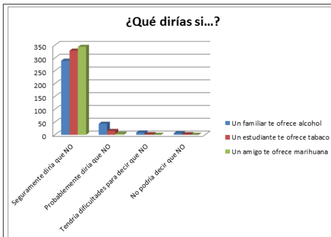
Figura 4. Actitudes ante situaciones concretas de ofrecimiento de sustancias.

En la situación concreta de ofrecimiento de alcohol en el contexto familiar, se han encontrado diferencias de género en el grado de seguridad para rechazar la oferta ( t = 2,271, p = ,024 ). Así, un 6,4% de los chicos, frente a un 1,9% de las chicas, informaron de que tendrían dificultades para negarse o no podrían decir que no ante esta situación. No se han encontrado diferencias de género en las situaciones concretas de rechazar la oferta de tabaco de otro estudiante ( t = -0,827, p = ,409 ) y rechazar la oferta de marihuana de un amigo ( t = -1,184, p = ,237 ).