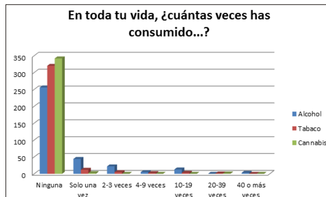
Figura 2. Frecuencia de consumo de alcohol, tabaco y cannabis.

Como se muestra en la Gráfica 3, casi la totalidad de los adolescentes afirmaron que definitivamente no probarían el alcohol (92,8%), el tabaco (97,1%) o el cannabis (98,8%) aunque tuviesen oportunidad para hacerlo. No se han encontrado diferencias de género en la actitud general hacia el consumo de bebidas alcohólicas ( t = 1,264, p = ,207 ), tabaco ( t = -0,417, p = ,677 ) o cannabis ( t = 1,761, p = ,079 ). De forma similar, cuando se presentan situaciones concretas de ofrecimiento de sustancias (ver Gráfica 4), la mayoría de los adolescentes informaron de que con seguridad dirían que no si un familiar les ofreciese alcohol (83,3%), si otro estudiante les ofreciese un cigarrillo (94,5%) o si un amigo cercano les ofreciese marihuana o hachís (98,8%).