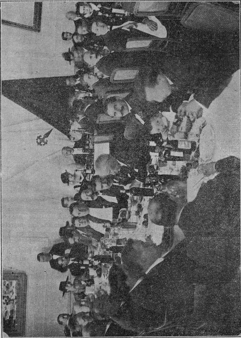
La cabecera de la mesa.