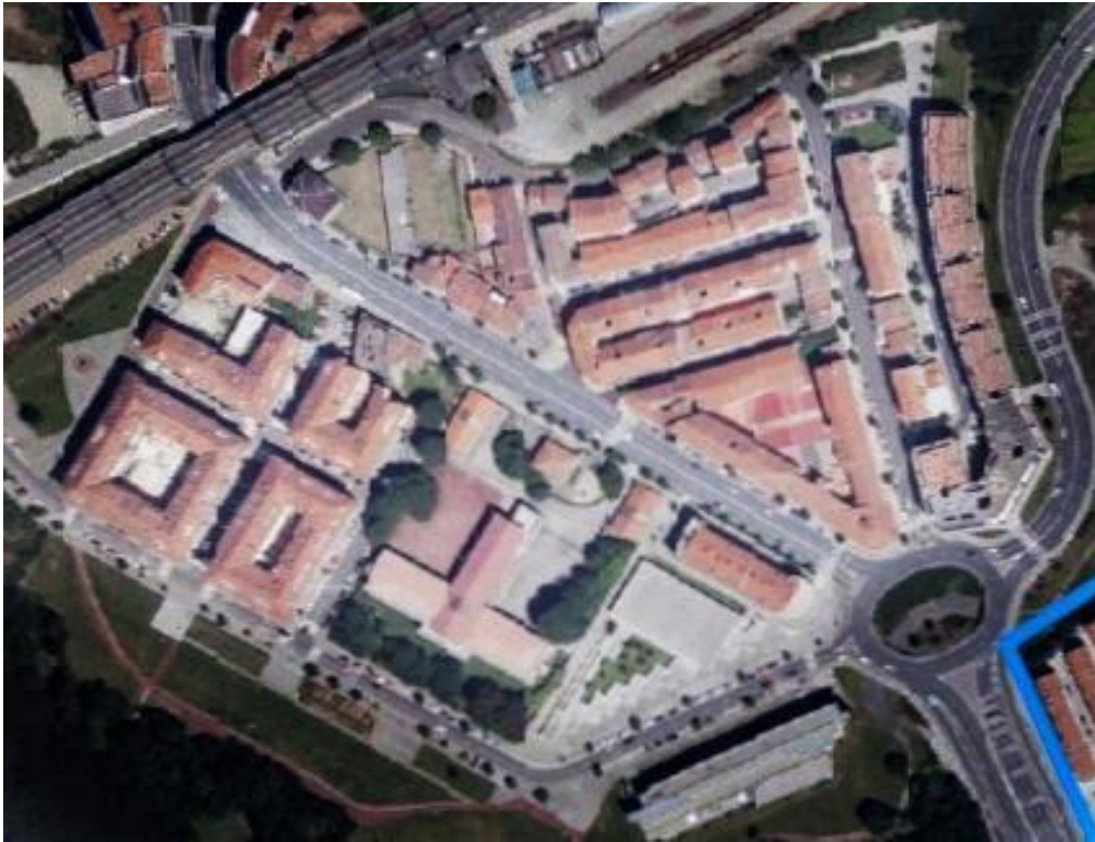
Vista satélite de Pontepedriña