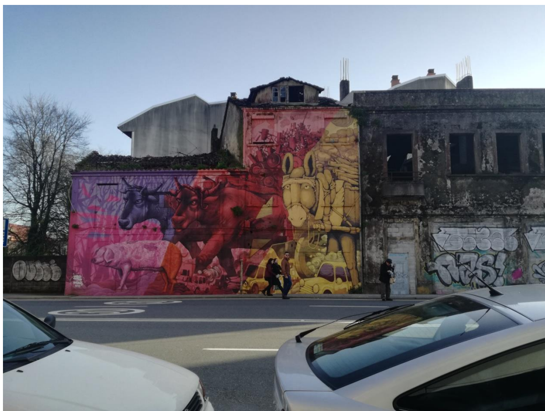
Uno de los murales del barrio, realizado en homenaje al viejo matadero que se ubicaba en la zona.

En cuanto al proyecto Con b de barrio impartido en esta zona, destacamos la iniciativa del Ayuntamiento de Santiago de Compostela para desarrollar un plan que apoye, estimule y haga despegar a los pequeños comercios de barrio. Fomenta sobre todo la colaboración entre negocios, tengan o no relación de mercado entre sí, con el objetivo