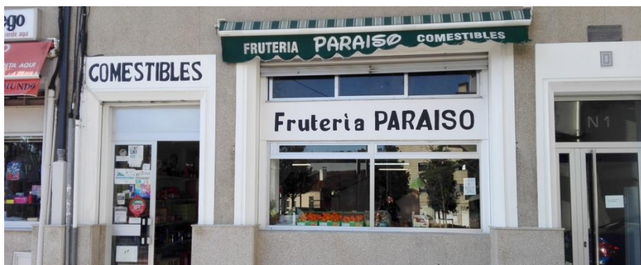
La tienda de comestibles lleva cuarenta años localizada en Pontepedriña.