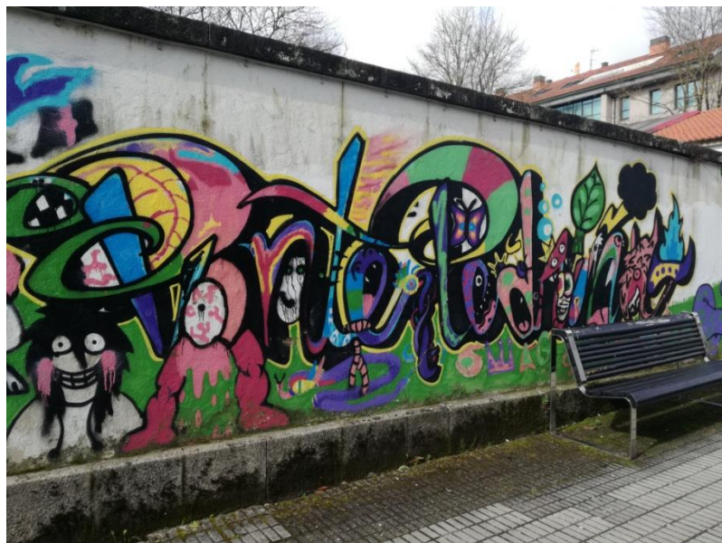
Graffiti fuera del parque aldaño al Centro Sociocultural con el nombre del barrio.