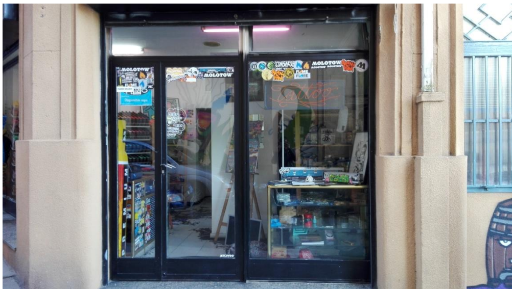
Entrada de Consafos, la tienda de suplementos para realizar graffitis.