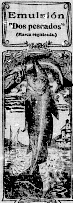
Emulsión "Dos pescados" (Marca registrada)