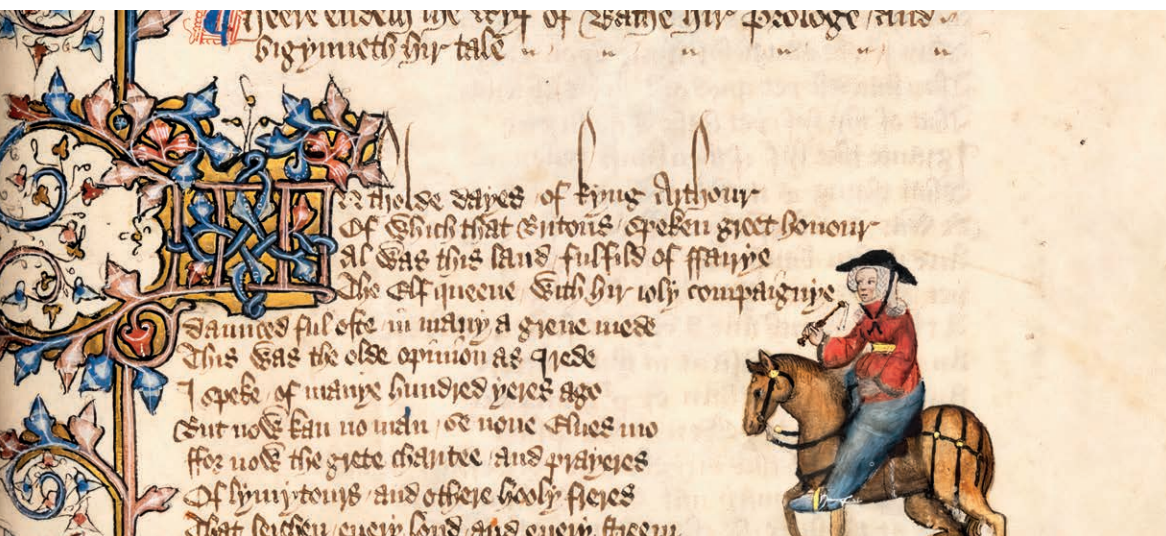
Fig. 1: Miniatura de peregrina, Canterbury Tales de Geoffrey Chaucer, Huntington Digital Library (Ms EL 26 C 9, f. 72 r). https://hdl.huntington.org/digital/collection/p15150coll7/id/2359 .

relata a súa experiencia vivida nas diferentes rutas, os preparativos, as dificultades que foi atopando 13 . A pesar de que a Igrexa se mostrou crítica con esta práctica en relación coas mulleres (sobre todo, a partir da concesión de indulxencias ligadas ás visitas a lugares sagrados), Domínguez Ferro chama a atención sobre a opinión de teólogos dos primeiros tempos de instauración da Igrexa que se manifestaron a favor da peregrinación feminina. Tal e o caso do teólogo Teodoreto, bispo de Ciro (s. V), que nos seus escritos recoñecía como exemplo de fortaleza a nai do emperador Constantino que incitaba á viaxe devota en busca de reliquias 14 .