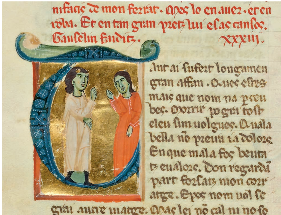
Fig. 3: Miniatura de Guilhelma Monja e Gaucelm Faidit. Bibliothèque National Paris, ms. fr. 854, f. 33v.

E romeu que Deus assi quer servir por levar tal furt' a Jelusalen, e sol non cata como Gris non ten nunca cousa de que s' ele cobrir , ca todo quanto ele despendeu e deu, dali foi; tod' aqesto sei eu e quant' ele foi levar e vistir. (18,41, vv. 15-21)