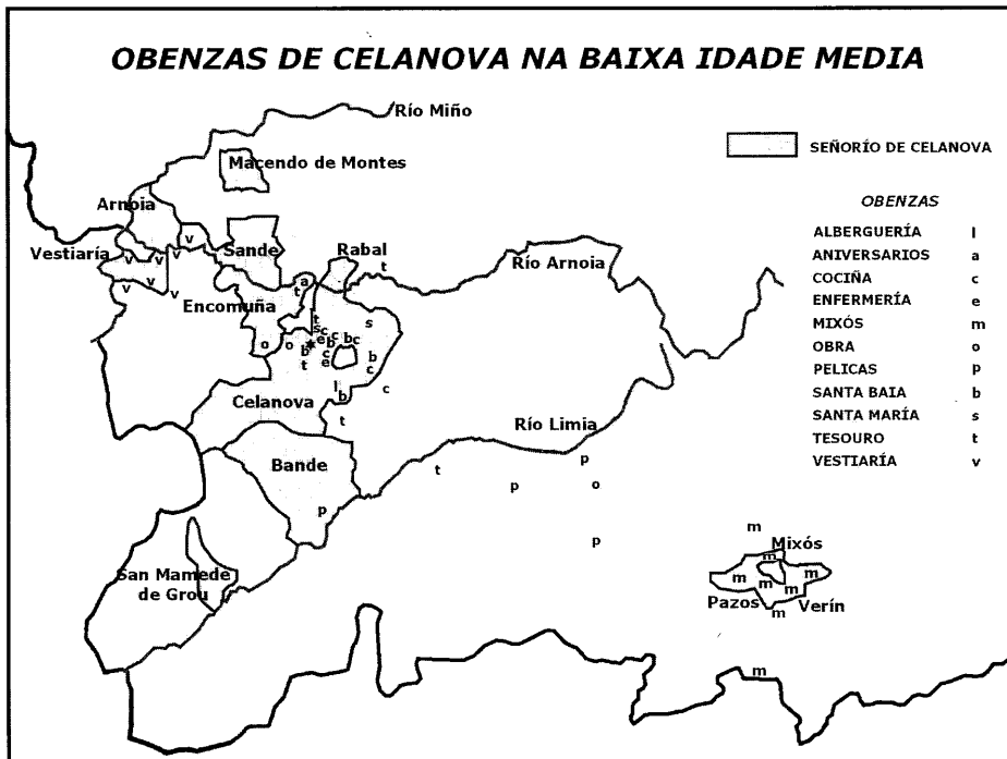
Fig. 3. Distribución dos bens das obenzas do mosteiro de Celanova.