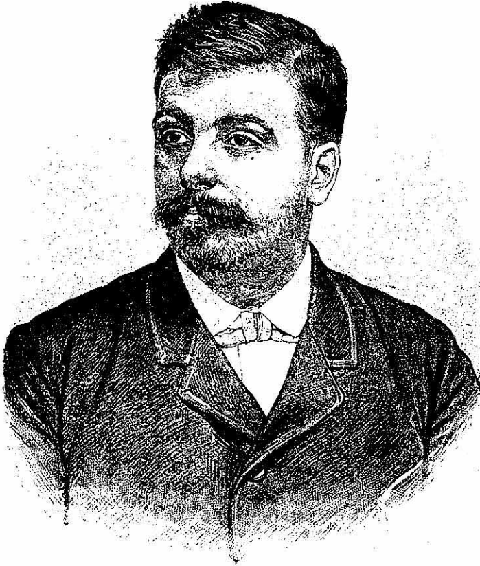
D. LUIS CASTELLS Y SIVILLA

No ha sido nuestro ánimo escribir una biografía completa de D. Luis Castells y Sivilla, que con profusión han publicado los periódicos españoles y bonarenses. Nos hemos propuesto simplemente desahogar nuestra satisfacción y dar rienda suelta á nuestro entusiasmo tributando un modesto pero cariñoso homenaje á un ilustre compatriota cuyas acciones bendice la generación presente y admirarán las venideras, y cuya historia es un consuelo para el desvalido, un estímulo para el hombre laborioso, un ejemplar digno de imitación para los ricos, un timbre de gloria para España y un título de noble y legítimo orgullo de Cataluña.