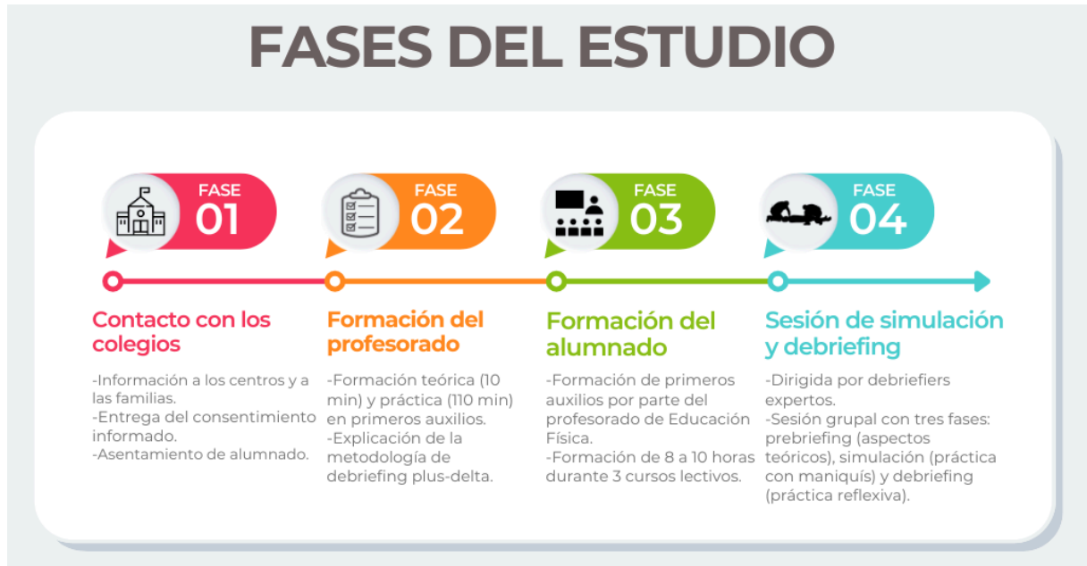
Figura 4. Pasos de la simulación. Elaboración propia