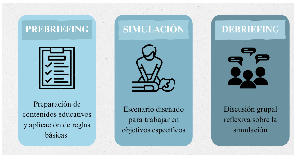
Figura 2: Pasos de la simulación. Elaboración propia a partir de datos de International Nursing Association for Clinical Simulation and Learning (INACSL), 2025

En el diseño de un escenario de simulación en base a unos objetivos formativos (en nuestro caso niños y adolescentes que identificarán una PCR y la asistirán mediante la realización de maniobras de SVB en base a los conocimientos adquiridos que presentan), se deben tener en cuenta tres pasos (18): (figura 2)