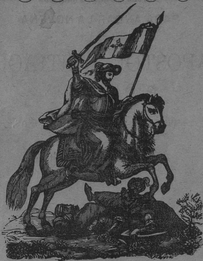
SANTIAGO APÓSTOL, PATRÓN DE LAS ESPAÑAS.

Esta obrita es propiedad del autor, y nadie sin su consentimiento podrá reimprimirla. Queda hecho el depósito que marca la ley.