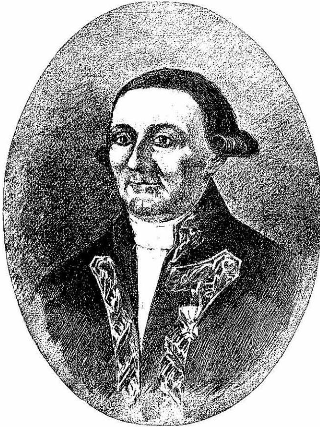
BRIGADIER D. ANTONIO OLAGUER FELIÚ