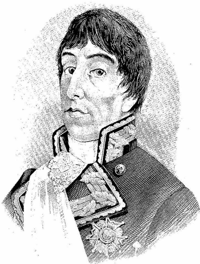
GENERAL DON JOSÉ DE BUSTAMANTE Y GUERRA