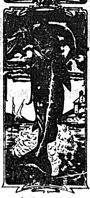
La última palabra

Nos referimos á una nueva y excelente preparación de Emulsión «DOS PESCADOS» (marca registrada) la que cumple con todas las condiciones y españolas, tanto en calidad como en precio.