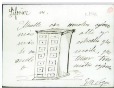
FIGURA 4: FICHA N.º 1 DE SIFONIER EN EL FICHERO GENERAL DE LA RAE

Por su parte, el DLE recoge chifonier y sifonier como artículos independientes, aunque en este último remite directamente al primero, por lo que se deduce que se prefiere chifonier , lo que se ajusta a su frecuencia en los corpus. En lo que respecta a la variante sinfonier , no se recomienda su empleo (veáse DPD , s. v. chifonier ).