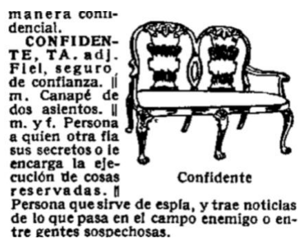
FIGURA 6: ARTÍCULO DE CONFIDENTE EN EL DMILE DE 1950

En este caso tampoco se han localizado testimonios del galicismo crudo confident . Por otra parte, la búsqueda en el CORPES XXI ofrece ejemplos en los que confidente se emplea como parte del léxico del mobiliario, lo que concuerda con el mantenimiento de su acepción como mueble en el DLE 56 . No obstante, la gran mayoría de las concordancias corresponden a otras acepciones del término 57 .