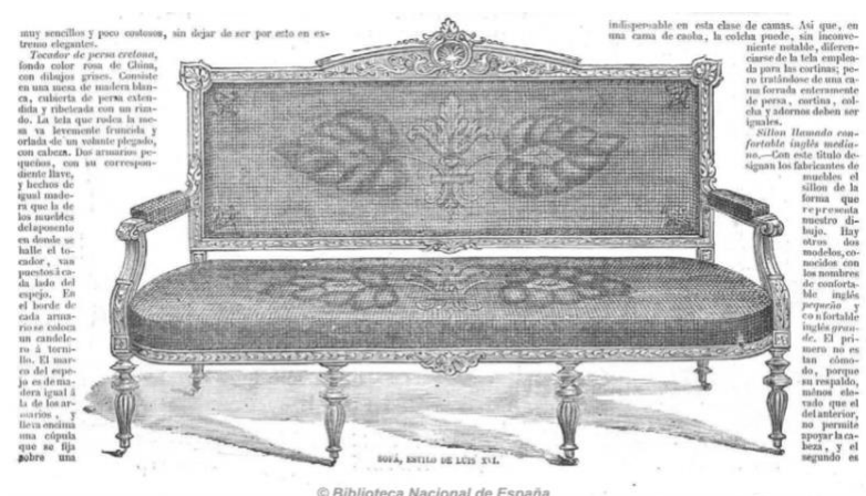
FIGURA 8: “SOFÁ ESTILO DE LUIS XVI” [14/10/1870] LA MODA ELEGANTE (CÁDIZ)

La presencia habitual de esta voz en las fuentes consultadas permite afirmar que sofá es uno de los galicismos del léxico del mobiliario más vigentes en la actualidad 83 .