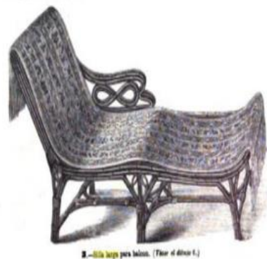
FIGURA 3: “SILLA LARGA PARA BALCÓN” [30/5/1880] LA MODA ELEGANTE

En cuanto a la pervivencia de la voz, en el CORPES XXI se documentan tanto chaise-longue como cheshlón 39 . Según el DPD , la forma adaptada se utiliza también en algunos países americanos como sinónimo de tumbona, si bien esta acepción no se atestigua en el siglo XIX 40 .