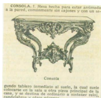
FIGURA 7: ARTÍCULO DE CONSOLA EN EL DMILE DE 1950

el uso para referirse al mueble se restringe principalmente a publicaciones de revistas especializadas en la decoración del hogar 63 .