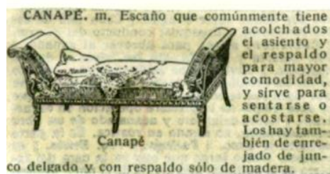
FIGURA 2: ARTÍCULO DE CANAPÉ EN DMILE DE 1950

La consulta del CORPES XXI muestra que la voz canapé sigue formando parte del léxico de mobiliario como ‘mueble para sentarse con el respaldo acolchado’, aunque también que es mucho más frecuente la acepción como aperitivo 35 . Camapé , en cambio, no presenta concordancias en este corpus.