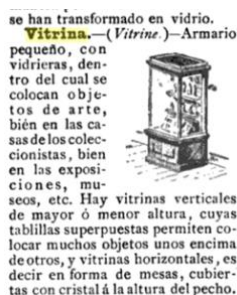
FIGURA 9: ARTÍCULO DE VITRINA EN EL VOCABULARIO DE TÉRMINOS DE ARTE (1887) DE ADELINE.

La difusión del vocablo con esta acepción se produce rápidamente si se toma como referencia el primer testimonio en la lengua francesa 86 . Su pervivencia actual se confirma en la consulta del CORPES XXI 87 .