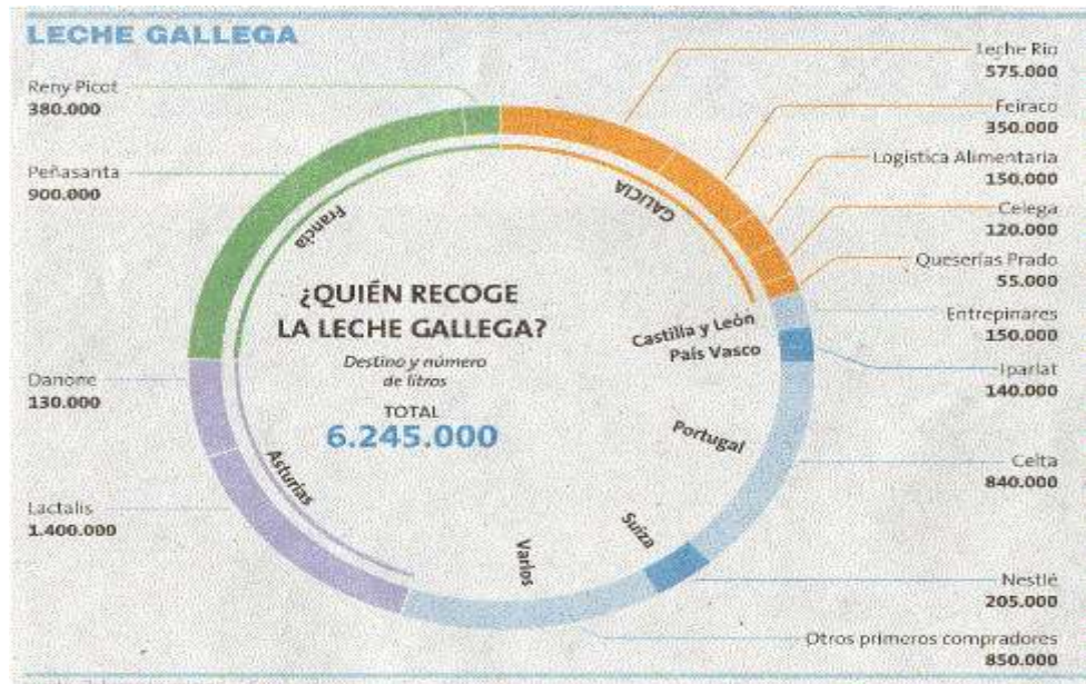
Imaxe 2. Empresas que recollen o leite en Galicia, en cantidades e por orixe.