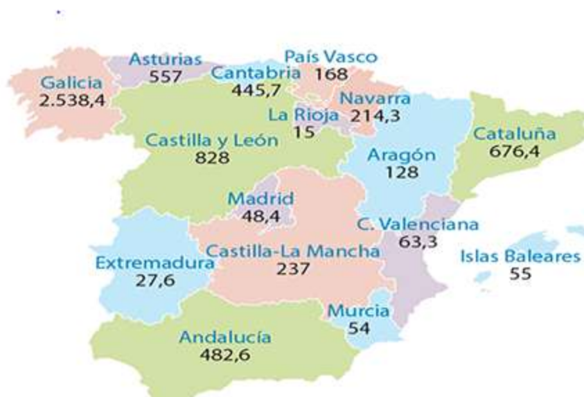
Imaxe 1. Producción de leite de vaca por comunidades autónomas. Ano 2014. Miles de toneladas.