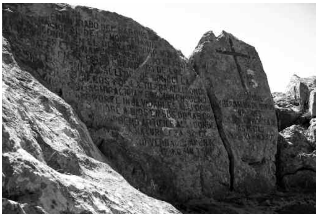
Fig. 1. Tumba del Marqués de Villaviciosa en Ordiales, Parque Nacional de Covadonga.

Leyes y en 1896 fue elegido diputado de las Cortes. Nombrado senador vitalicio en 1914, la afición al arte, a los monumentos, a la historia, a la caza y a los paseos por los parajes más bellos y salvajes, convertirán al Marqués en el primer adalid en la península de los paisajes naturales concretos, "paseables" y físicos. Sin duda, fue el paisaje artístico y literario forjado y defendido con anterioridad el que enseñó a Pidal el camino a seguir en relación con el paisaje natural. Aquellos paisajes que en España apenas llevaban setenta años siendo retratados –piénsese que Villaamil pintó Covadonga y los Picos de Europa en 1847 y 1850, y que Quadrado y Parcerisa se ocuparon de describir y dibujar la Cascada de Soaso o "Cola de Caballo" del Parque de Ordesa hacia 1844 3 – encontraron en él a su primer defensor con poder político. La influencia de la concepción artística y romántica del paisaje se hace notar en los discursos y cartas que conservamos del Marqués. Éste concebía los parques como grandes san-