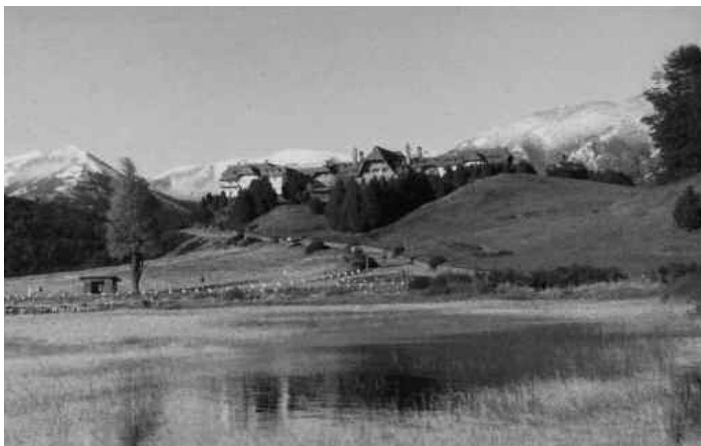
Fig. 3. Parque Nacional Nahuel Huapi (Argentina) y Hotel Llao Llao. Década de 1980.

turísticas y como centros que, a través de esta actividad, garantizarían el desarrollo económico en la región.