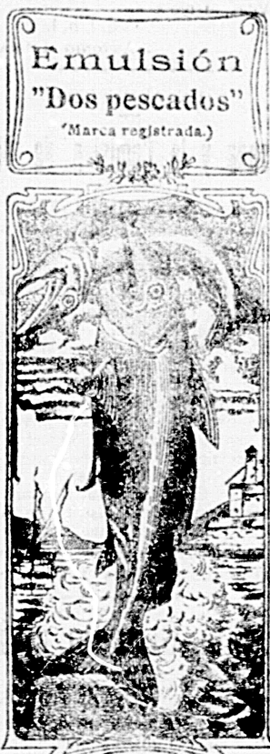
Emulsión "Dos pescados" (Marca registrada)

Nos referimos a una nueva y excelente preparación de Emulsión «DOS PESCADOS» (marca registrada) la que compete con todas las extranjeras y españolas, tanto en calidad como en precio. Depositarios: por menor, Farmacia y Laboratorio de Iglesias. Por mayor, Droguería de Iglesias y Compañía.