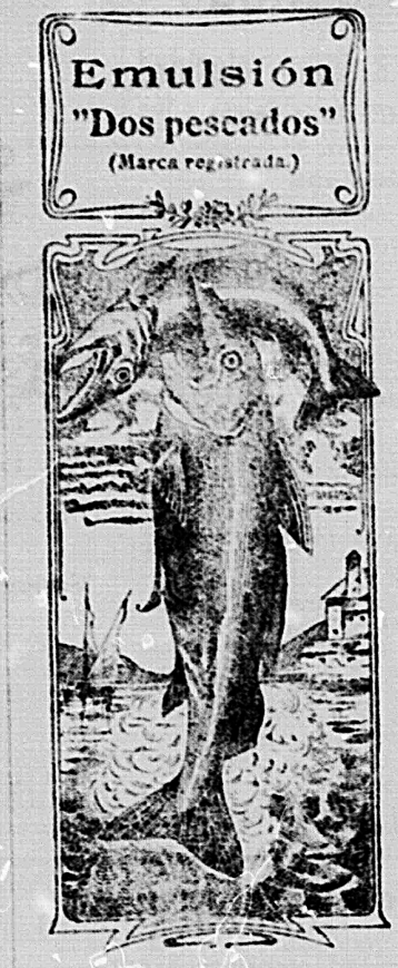
La que en menos tiempo alcanzo mas popularidad y estimación de la clase médica y obtuvo más medallas de oro. De Lopen.