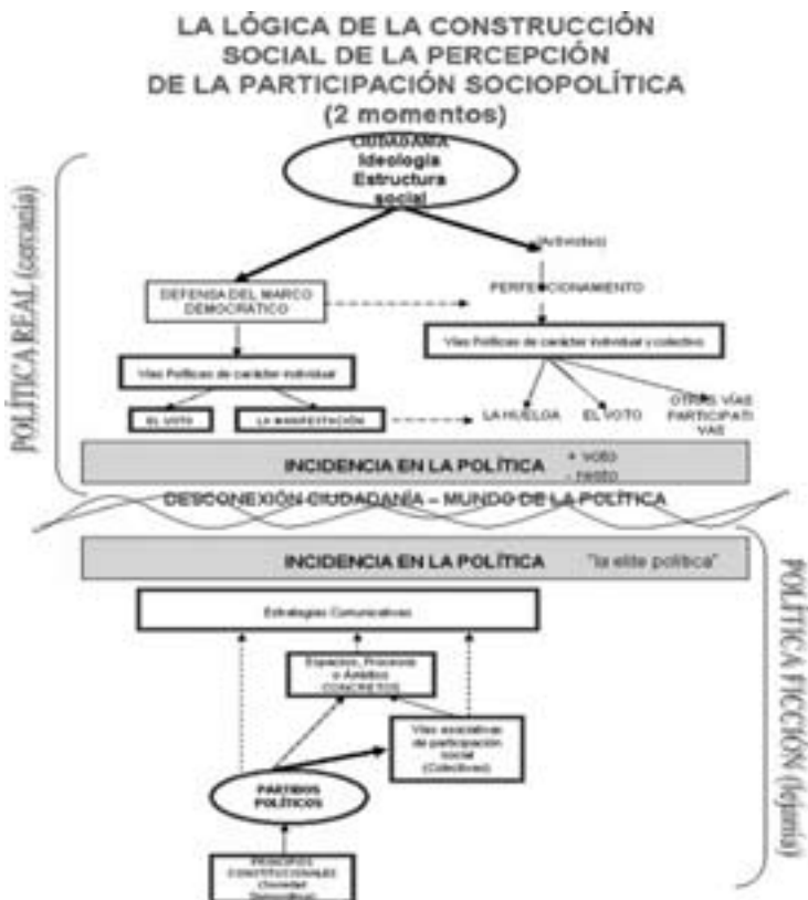
Cuadro 2 Lógica de la percepción de la participación sociopolítica

Para terminar este apartado hacemos referencia a lo expuesto al principio. Si participación sociopolítica es, tal y como la hemos definido, los actos o actividades realizadas por cualquier ciudadano que tratan de influir, directa o indirectamente, en las decisiones adoptadas por las autoridades políticas y sociales (elegidas o no) y que afectan a los asuntos de la colectividad, qué podemos decir acerca de cómo entiende la ciudadanía la participación. En el siguiente cuadro se presenta de forma gráfica esta cuestión: