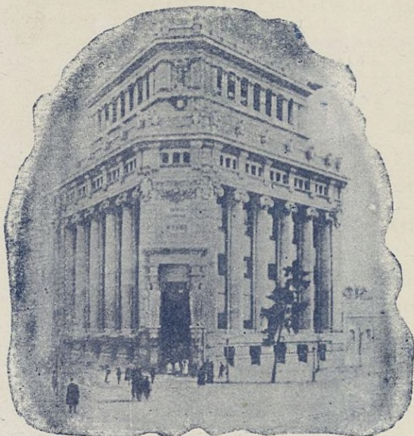
Edificio de la sucursal en Madrid