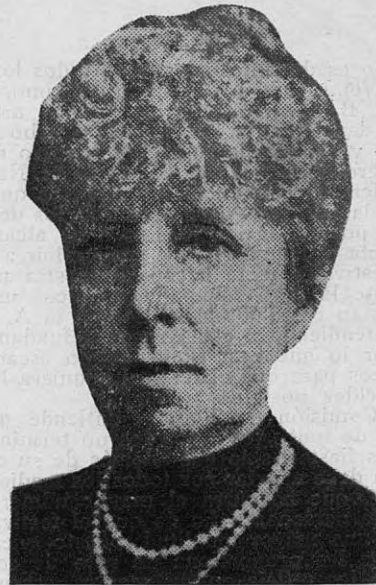
La reina madre, Da. María Cristina, de España, fallecida inesperadamente en el Palacio de Oriente, de Madrid, el día 6 del actual, a las 3.30 horas, causando honda consternación en toda la península