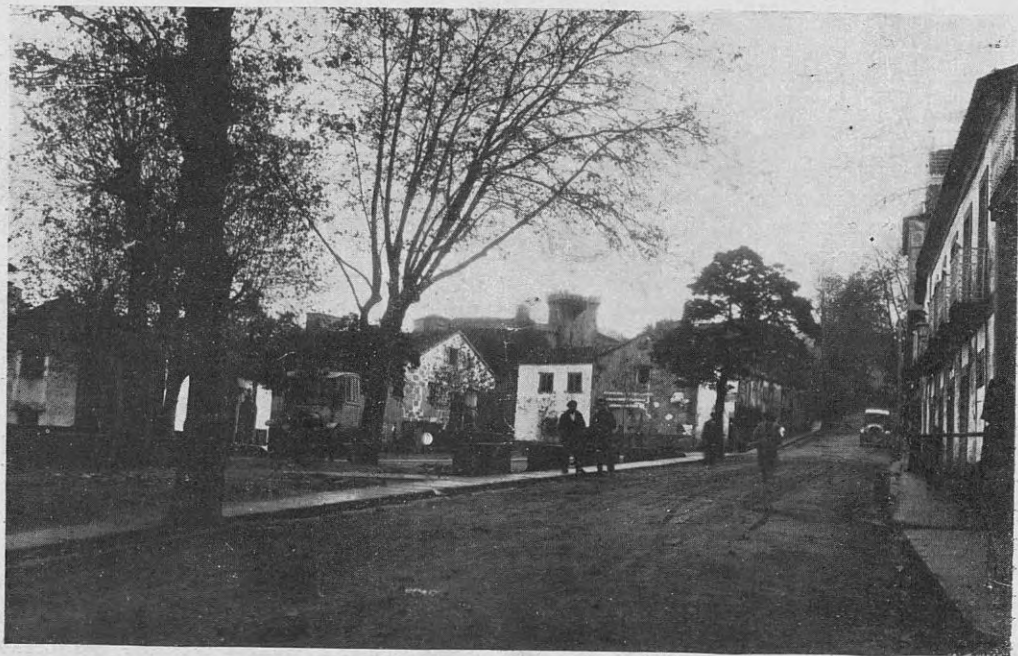
VIMIANZO — Su plaza principal