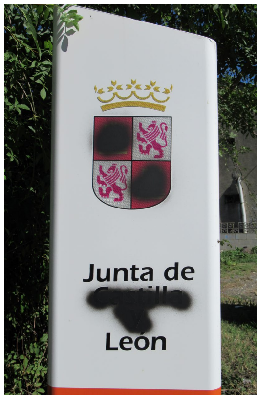
Figura 4. En los marcos miramétricos de las carreteras de titularidad autonómica, en León se suele eliminar tanto el escudo como el corónimo castellanos, como en este caso en Santa Cruz del Sil (Páramo/Páramu del Sil).

En este sentido, el gobierno regional se considera distante e inhibidor del desarrollo territorial de León: «La Junta es una administración lejana y que siempre está intentando ponernos trabas y, además, sin ocultarse» (E3) (figura 4). Se suele concretar este rol nocivo para León en la ciudad de Valladolid, a la que se presenta como succionadora del territorio leonés: «No nos han llevado la catedral [de León] a Valladolid porque no han podido, pero no sé si con el tiempo piedra a piedra, grano a grano, irán llevándola, es una vergüenza» (E8). En este contexto, y si bien la descentralización de España se podría entender como el fin del centralismo madrileño, en León se percibe que Valladolid se ha erigido en nuevo baluarte capitalino; de esta forma, acaba por emerger un nuevo centralismo vallisoletano: