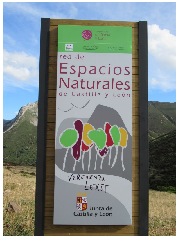
Figura 2. Pintada reivindicativa favorable al Lexit en la entrada desde Asturias al Parque Natural de Babia y Luna, perteneciente a la Red de Espacios Naturales Protegidos de Castilla y León.