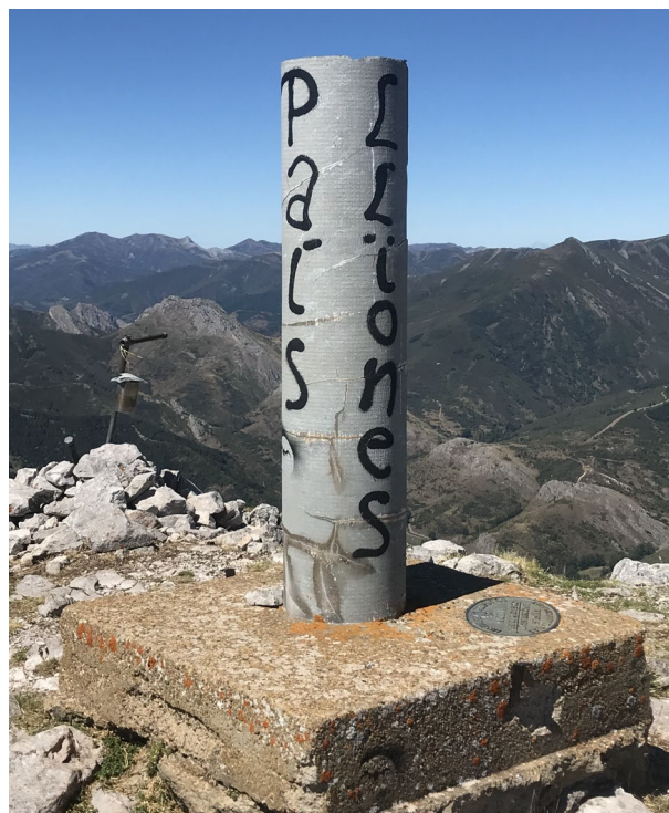
Figura 5. Las pintadas reivindicativas suelen hacer referencia a «País Llionés», como esta del Pico Bodón (Valdelugueros/Valdellugueros).

Burgueño (2011) advierte que la identidad provincial en buena parte de la antigua Corona de Castilla está muy arraigada; por ello, la articulación de regiones pluriprovinciales resulta siempre problemática, tal y como García Álvarez (2002) relata detalladamente. Al fin y al cabo, no se puede olvidar que, para Agnew (2018, 24), la principal dificultad que plantea el hecho regional, que considera «lábil y resbaladizo», estriba en la fijación de sus fronteras. Es más, desde una perspectiva ontológica, buena parte de la NGR surge como reacción a una visión asentada de la región como realidad indudable dotada de fronteras definidas y atemporales (cfr. Lacoste 1976; García Álvarez 2006). El caso aquí estudiado contribuye a desmentir este planteamiento ya desfasado. A su vez, cabe tener en cuenta que el corónimo no parece despertar en nuestras entrevistadas demasiado acuerdo —¿Región Leonesa, Comunidad Autónoma Leonesa, León, País Leonés, (Antiguo) Reino de León...? (figura 5)—, lo que revela la existencia de diversas visiones sobre el nombre —y los límites asociados— de la nueva entidad regional; esto es muestra de la dificultad de encontrar un término único para la región, atribución que estaría conectada con la segunda fase del modelo de Paasi (1986).