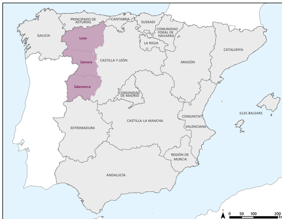
Figura 1. La Región Leonesa en el mapa autonómico actual.

Las preguntas en torno al recorrido que estas mociones pueden alcanzar se han ido sucediendo en las plataformas mediáticas; sin embargo, se antoja necesaria una investigación interpretativa que analice lo que está ocurriendo a la luz de los postulados de un corpus teórico que nos parece pertinente para ello, como es el de la Nueva Geografía Regional (NGR), una suerte de interfaz, generada a partir de la década de 1970, entre la Geografía Regional, la Geografía Cultural y la Geopolítica. Perseguimos además elucidar el porqué de este planteamiento contemporáneo y determinar de qué forma (re)elabora visiones precedentes que apuntaban en una dirección similar. A su vez, y relacionado con lo anterior, resulta de interés escudriñar las razones de la velocidad de propagación del discurso, así como aventurar su sostenibilidad en el tiempo, habida cuenta de que se le ha tildado repetidamente de adventicio.