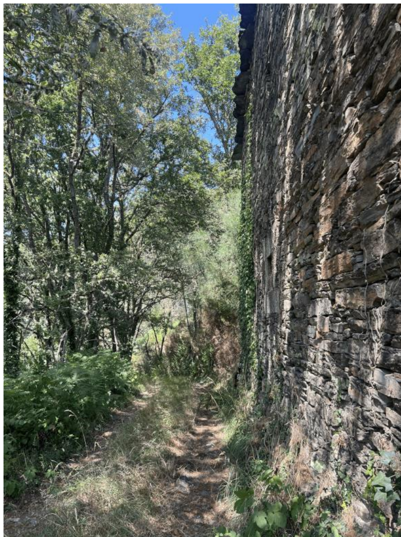
Nota. Material de autoría propia.