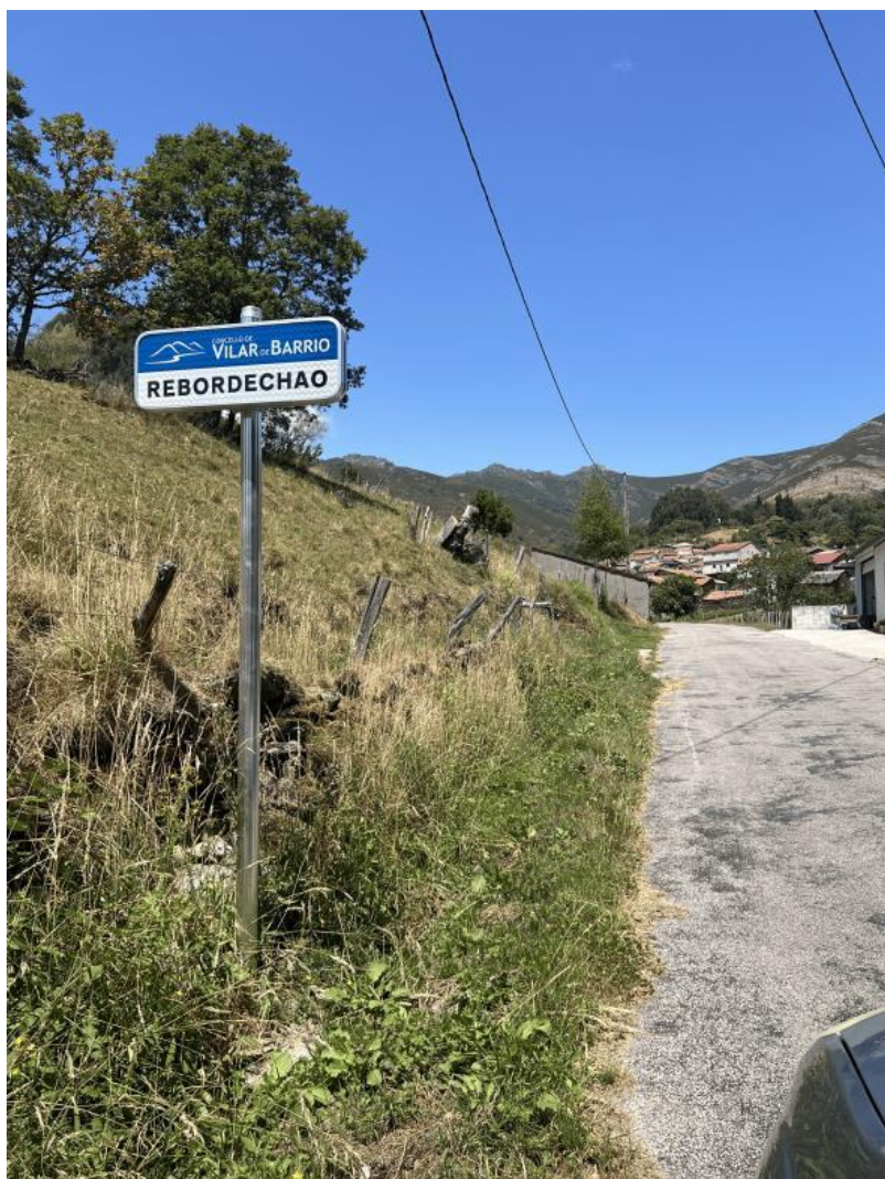
Nota. Material de autoría propia.