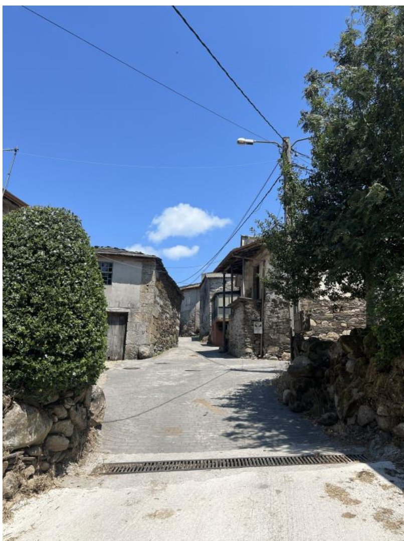
Nota. Material de autoría propia.