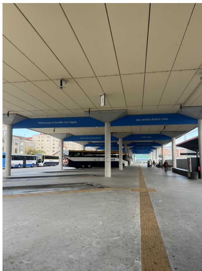
Nota. Material de autoría propia.