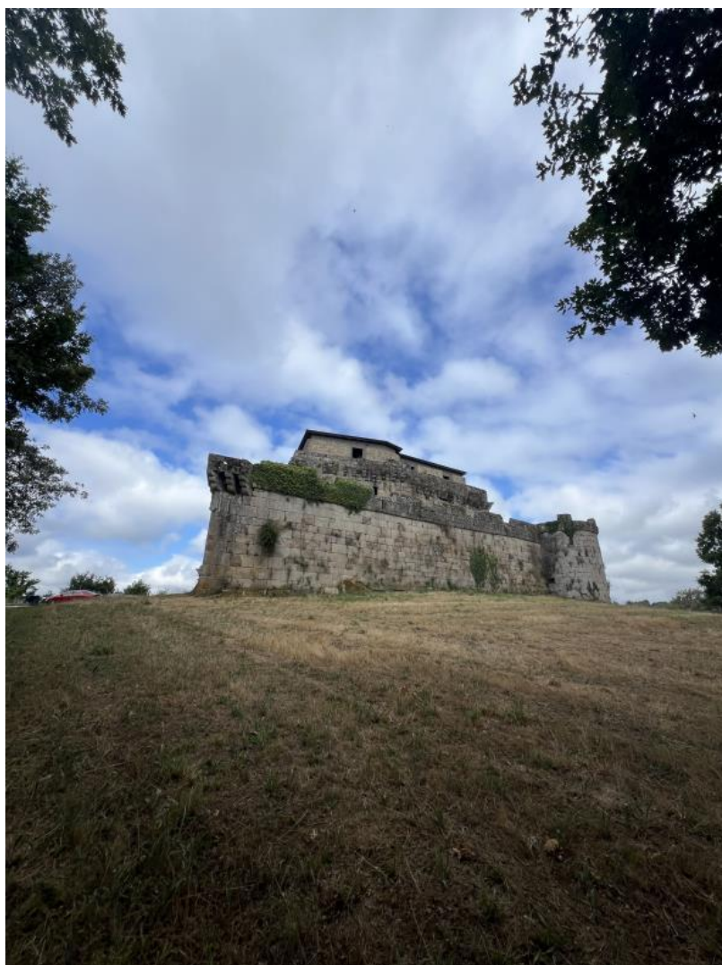
Nota. Material de autoría propia.