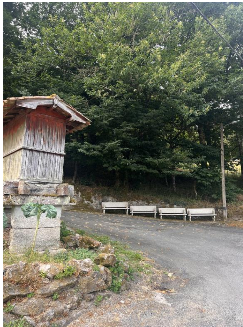
Nota. Material de autoría propia.