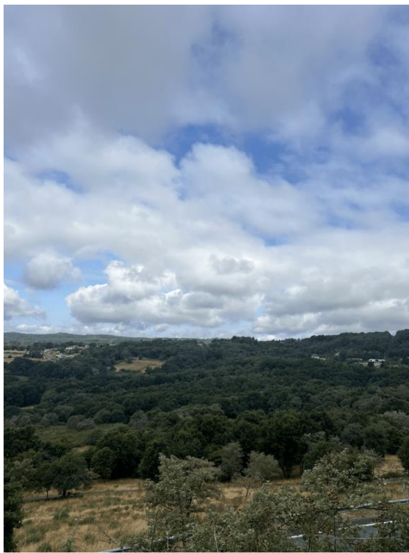
Nota. Material de autoría propia.