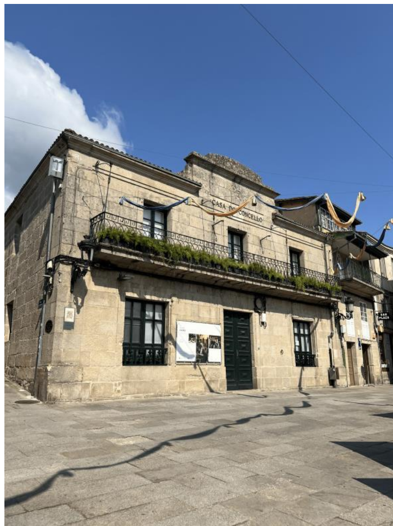
Nota. Material de autoría propia.