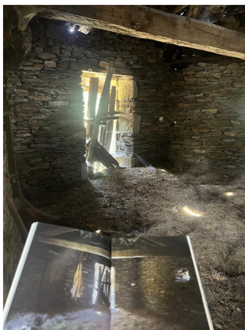
Nota. Material de autoría propia.