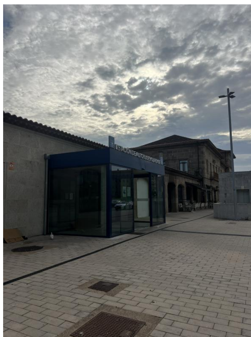
Nota. Material de autoría propia.