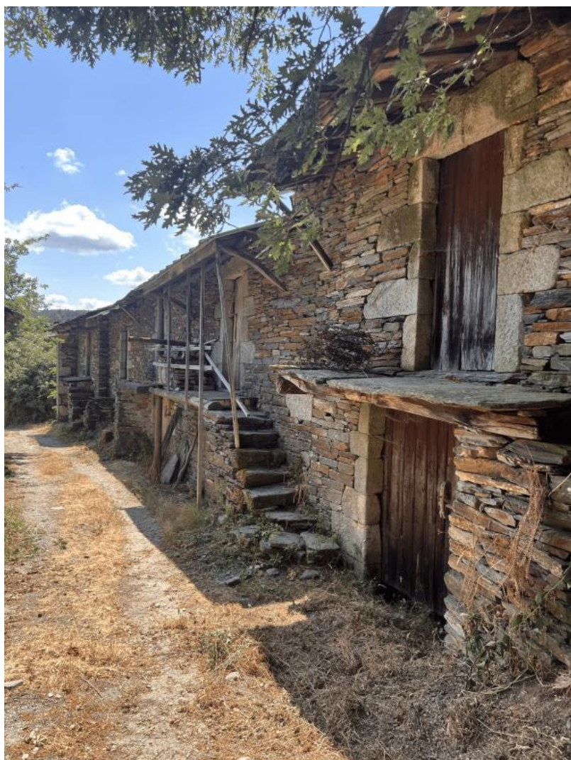
Nota. Material de autoría propia.