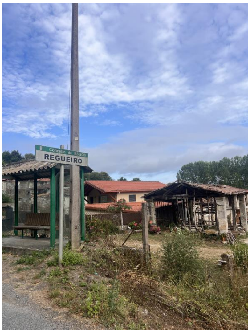
Nota. Material de autoría propia.