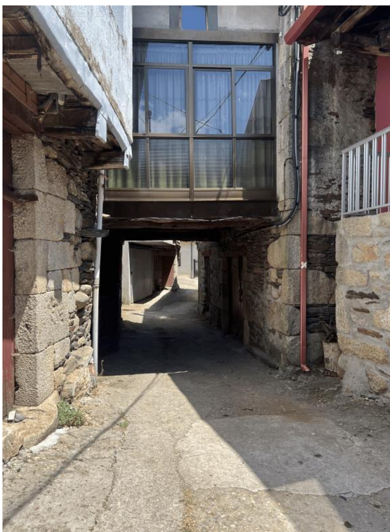
Nota. Material de autoría propia.