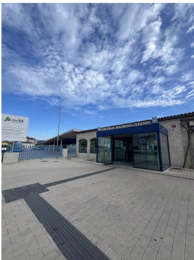
Nota. Material de autoría propia.