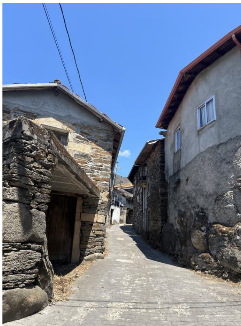
Nota. Material de autoría propia.