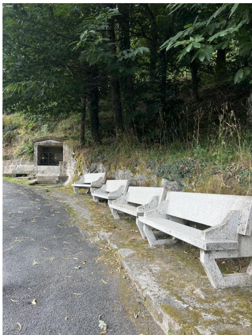
Nota. Material de autoría propia.