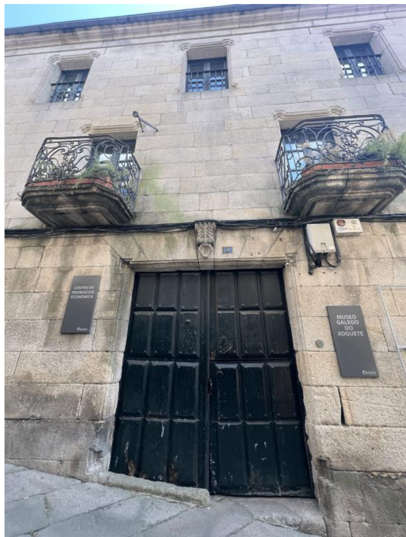
Nota. Material de autoría propia.