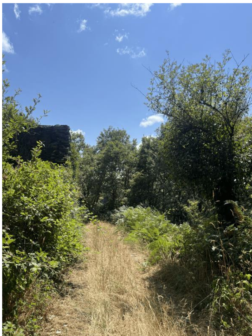
Nota. Material de autoría propia.