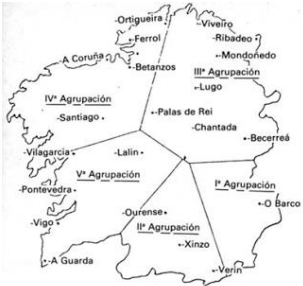
Mapa 1. División do territorio segundo as Agrupacións da Guerrilla en Galicia