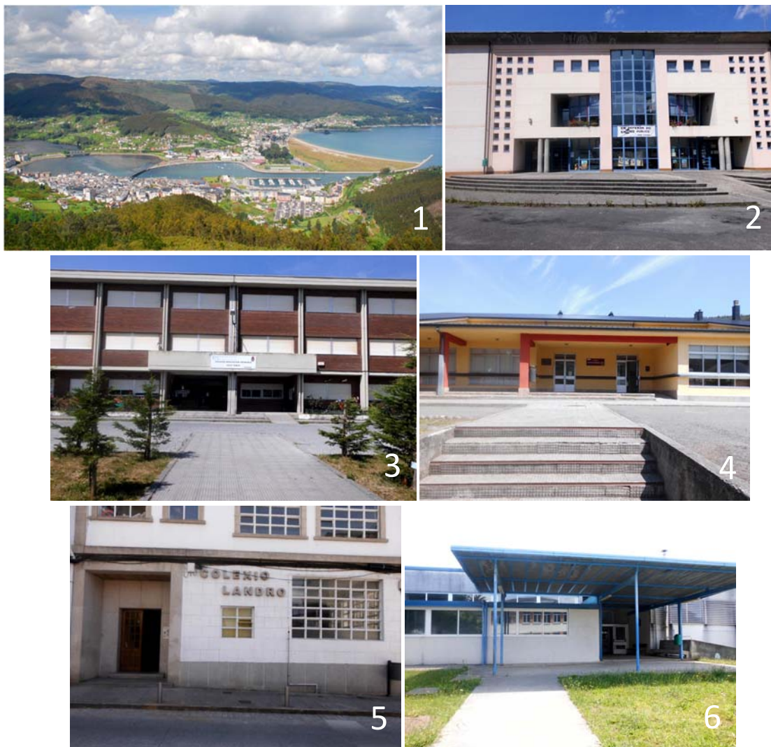
Figura 2. Vila de Viveiro (1), CEIP de Covas (2), CEIP Lois Tobío de Viveiro (3), CEIP Antonio Pedrosa Latas de Celeiro (4), CPR Landro de Viveiro (5), CEIP Santa Rita de Galdo (6).

El Maestro 2 (M2) es tutor de cuarto curso de educación primaria y director del CEIP Santa Rita de Galdo (ver Figura 2), en esta misma parroquia. Se incorporó a este centro hace 18 años, después de trabajar como docente en varios centros de la provincia de Lugo. A lo largo de su carrera profesional impartió clase en todos los cursos de educación primaria.