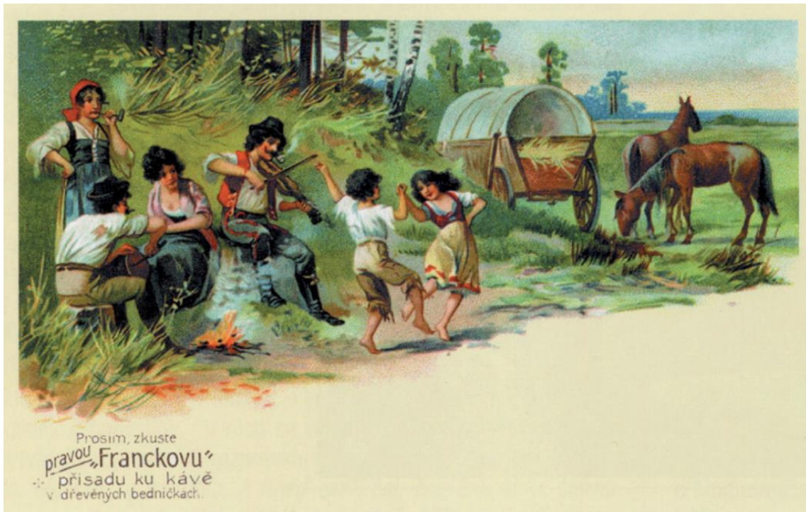
Figura 2: O estereotipo da vida libre na natureza nunha postal.

Nesta postal checa de comezos do século XX, observamos unha representación da vida xitana libre na natureza, con elementos típicos como a caravana, os cabalos, os nenos bailando e os adultos ociosos, un deles tocando o violín.