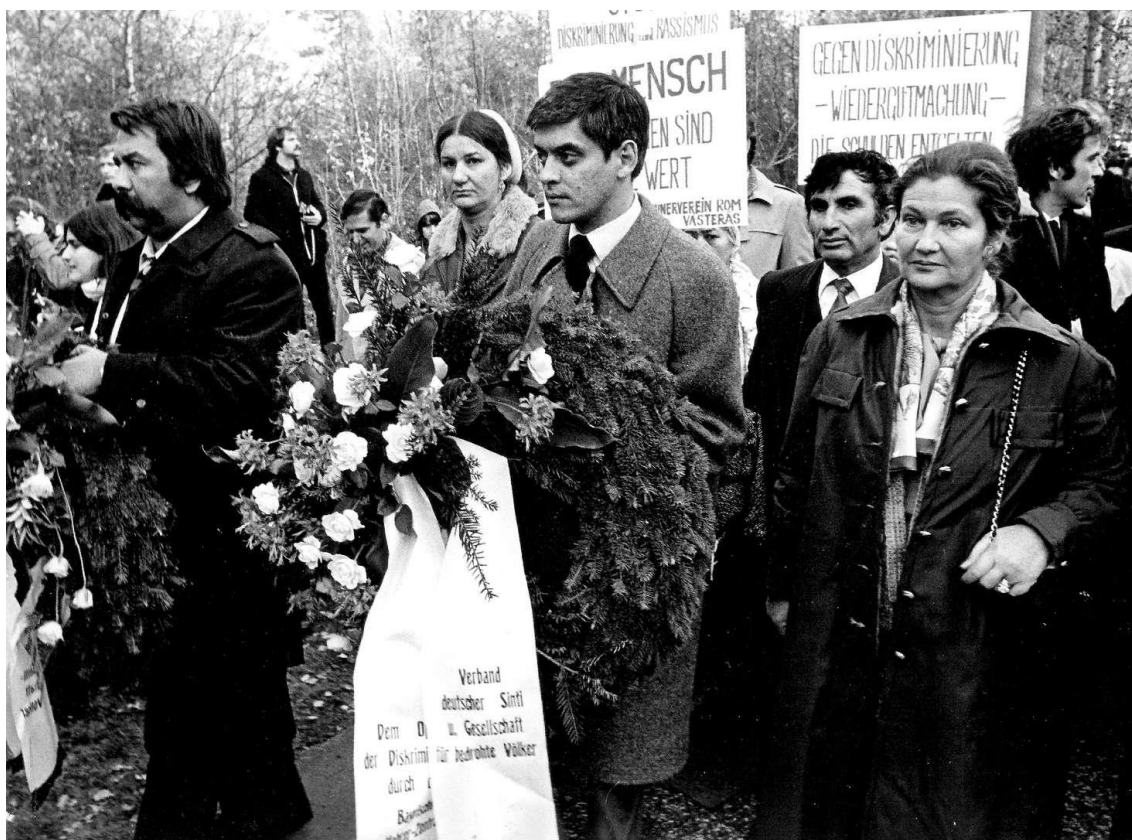
Figura 3: Manifestación en Bergen-Belsen o 27 de outubro de 1979.

No centro Romani Rose, líder do movemento romaní polos dereitos civís en Alemaña e presidente do Consello Central dos Sinti e Roma Alemáns desde a súa fundación en 1982. Á súa dereita, Simone Veil, xudía supervivente ó Holocausto e presidenta do Parlamento Europeo neste momento. Acudiron unhas 2.500 persoas, contando con activistas alemáns e doutras nacionalidades, superviventes romaníes e xudeus, así como parlamentarios alemáns.