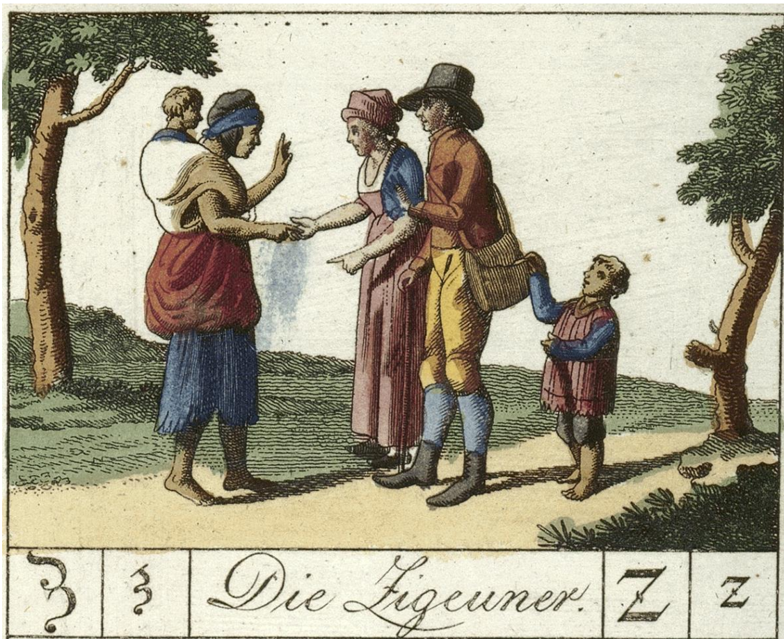
Figura 1: Estereotipo dos xitanos como ladróns nun abecedario.

O Buchstabil und Lesebuch ou Libro de ortografía e lectura de Johann Wolf, publicado en 1799, ilustra a letra Z de Zigeuner cunha escena dun roubo por un neno, mentres que unha muller lle a fortuna dos viandantes, distraéndoo.