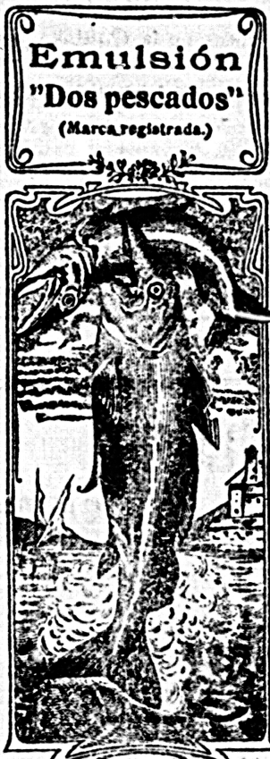
Emulsión "Dos pescados" (Marca registrada)

Informará su dueño en la referida casa de la calle de San Marcos.