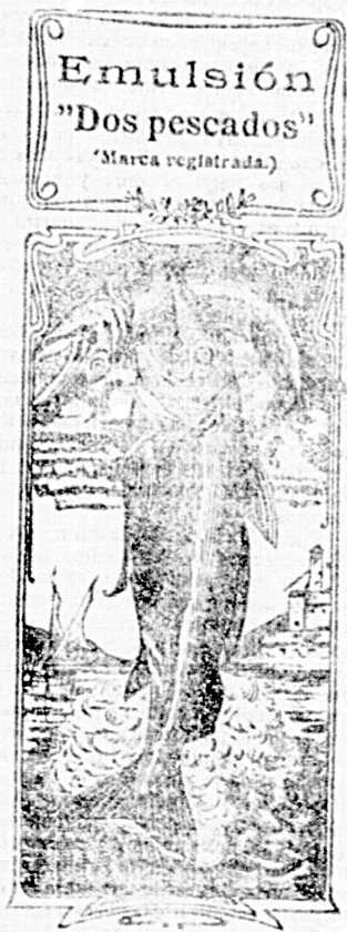
Emulsión "Dos pescados" (Marca registrada.)

Nos referimos a una nueva y excelente preparación de Emulsión «DOS PESCADOS» (marca registrada) la que combinada con todas las extracciones y «españoles» tanto en calidad como en precio. Depósitos: por menor, Farmacia y Laboratorio de Iglesias. Por mayor, Droguería de Iglesias y Compañía.