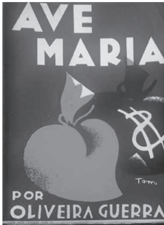
Capa de Ave Maria (Porto, 1922)