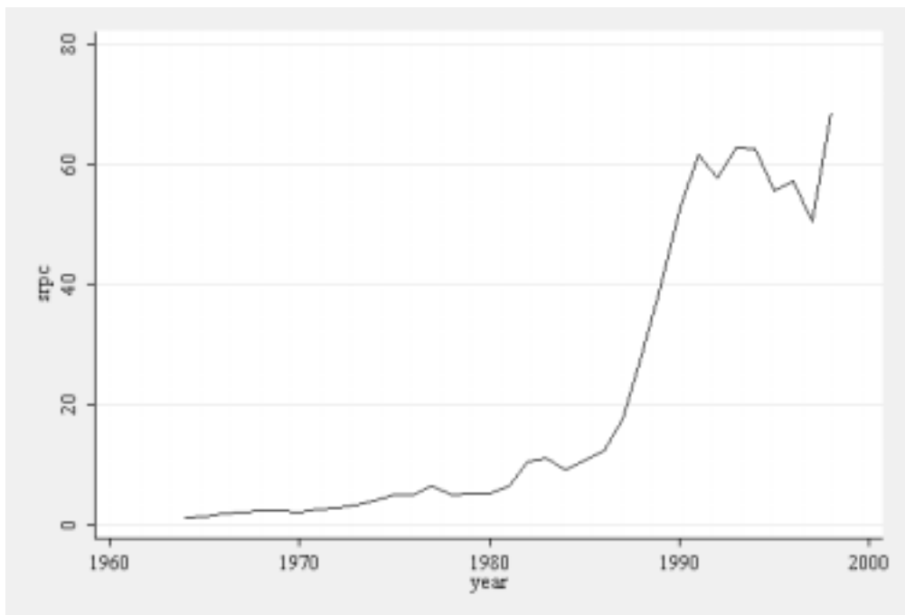
Gráfico 1: Evolución del gasto por habitante en carreteras.

El PSOE llega al gobierno central en 1982 con una mayoría absoluta de 202 diputados (sobre 350), lo que representa al 48,36% del electorado. Durante las siguientes convocatorias electorales (1986, 1989 y 1993) renovará su mayoría (las dos primeras con mayoría absoluta, la tercera sin la misma), para perder las elecciones en 1996, con un suelo electoral del 37,63 % y 141 escaños. Como cabe apreciar en el gráfico 1, , la política de gasto en carreteras subió de manera exponencial a finales de los 80 para mantenerse (con algunos retrocesos) en la primera mitad de los 90. ¿Contribuyó esta generosa política de carreteras 17 a la larga etapa del PSOE al frente del gobierno?