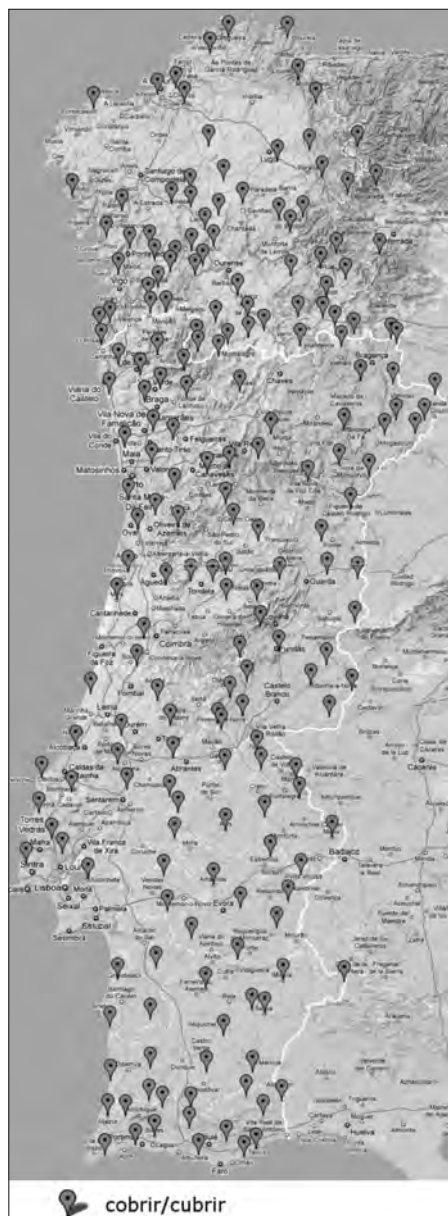
Mapa 8. 'Cubrir'. Formas con destacada presenza nos dous países.