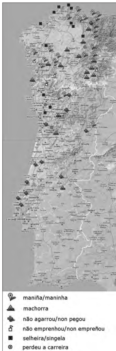
Mapa 4. 'Vaca libre, sen crías'. Formas con destacada presenza nun país e minoritarias no outro. Formas minoritarias.