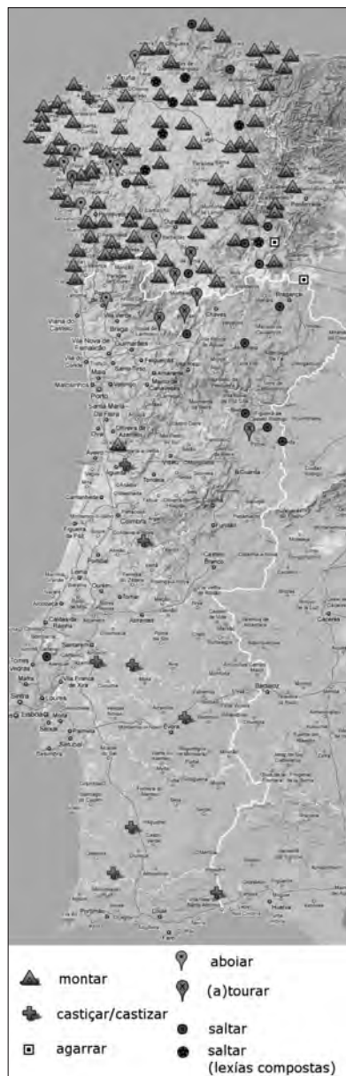
Mapa 9. 'Cubrir'. Formas con destacada presenza nun país e minoritarias no outro. Formas minoritarias.