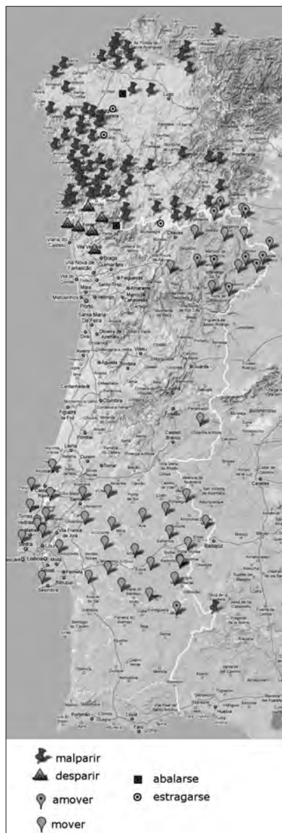
Mapa 2. 'Abortar'. Formas con destacada presenza nun país e minoritarias no outro. Formas minoritarias.