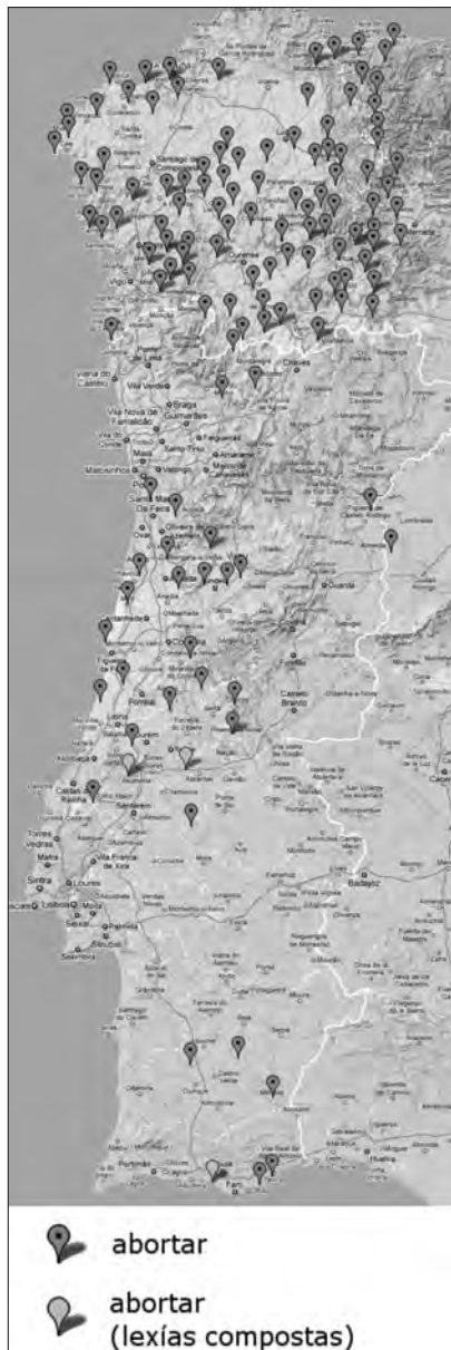
Mapa 1. 'Abortar'. Formas con destacada presenza nos dous países.