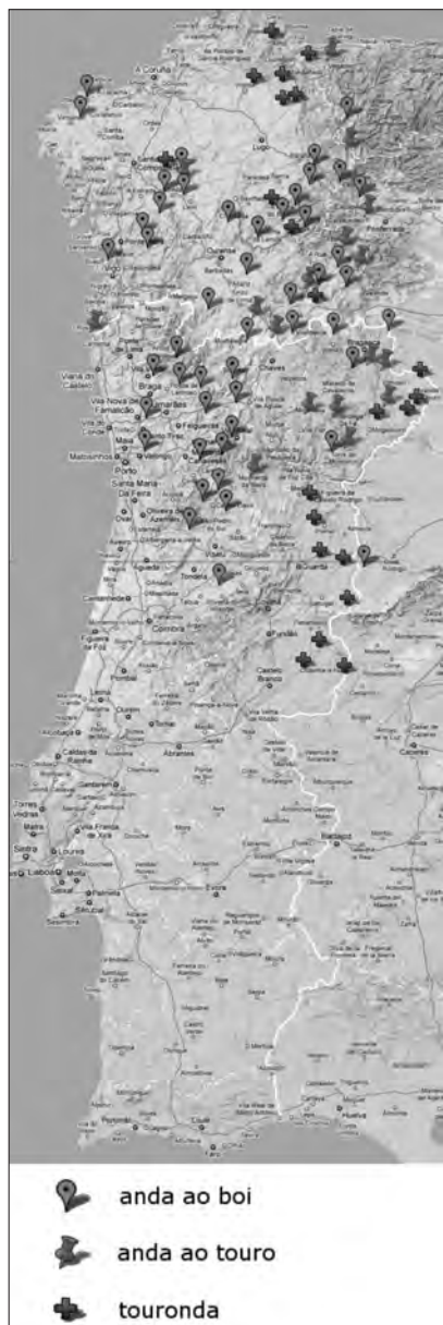
Mapa 6. 'Vaca quente, saída'. Formas con presenza notable, equilibrada nos dous países.