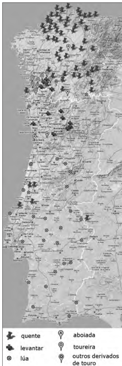
Mapa 7. 'Vaca quente, saída'. Formas con destacada presenza nun país e minoritarias no outro. Formas minoritarias.