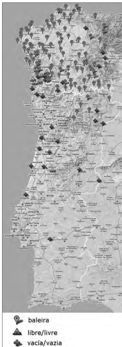
Mapa 3. 'Vaca libre, sen crías'. Formas con destacada presenza nos dous países