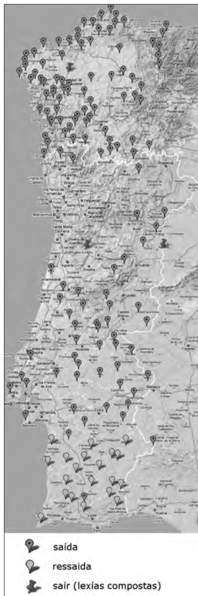
Mapa 5. 'Vaca quente, saída'. Formas con destacada presenza nos dous países.