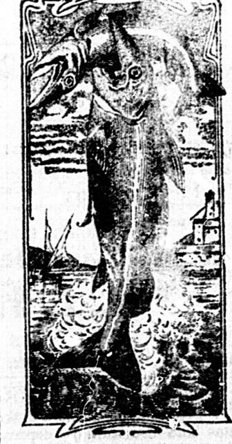
La última palabra

Nos referimos á una nueva y excelente preparación de Emulsión «DOS PESCADOS» (marca registrada) la que compete con todas, las extranjeras y españolas, tanto en calidad como en precio.