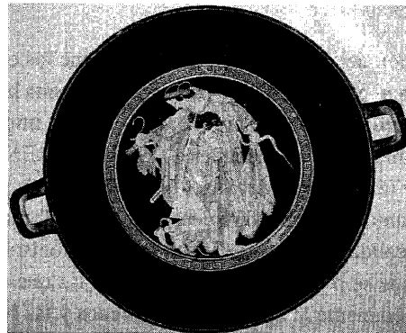
Lámina 6. Copa de figuras rojas con Tetis y Peleo (Berlín F 2279).