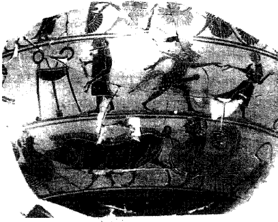
Lámina 3. Dino de figuras negras (Atenas, Museo del Ágora P 334) (Foto: Isler-Kerenyi 2001, fig. 34).