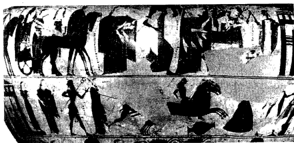
Lámina 7. Vaso François, detalle del episodio de Aquiles y Troilo (Foto: J. Boardman, Athenian Black-Figure Vases , Londres, 1974, fig. 46.5).

Por último, visualmente, la escena tiene curiosas evocaciones sobre las que Isler-Kerenyi también llama la atención. La composición, la huida de la Ninfa, la cabriola del caballo y la proporción del Sileno en relación con su caballería recuerdan la escenas del acecho de Troilo por parte de Aquiles –como la del vaso François (Lámina 7). La ver-