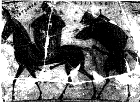
Lámina 1. Vaso François, detalle de la franja del Retorno de Hefesto al Olimpo. Florencia, Museo Arqueológico 4209. (Foto: J. Boardman, Athenian Black-Figure Vases , Londres, 1974, fig. 46.7).

rizados por la mezcla de elementos humanos y equinos– y las Ninfas juntos 8 , acompañando a Dioniso y a Hefesto en su vuelta al Olimpo, e identificados por sus nombres inscritos a su lado –ΣΙΛΕΝΟΙ, ΝΥΦΑΙ (Lámina 1)– se convierte en la ratificación de la imagen de los Silenos –cuya apariencia no describen las fuentes arcaicas–, en la constatación de la relación entre ambos colectivos –que se refuerza en la imagen del tercer Sileno de la procesión que lleva en sus brazos a la primera de las Ninfas– y, además, en la “carta de constitución”