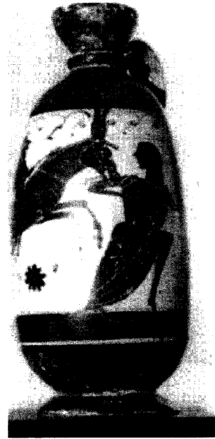
Lámina 2. Lécito de figuras negras (Búfalo, Albright Gallery G 600).

Una pareja de Sileno y Ninfa es la única decoración del lécito de Búfalo (Lámina 2), que muestra una escena única en su género 17 , en la que un sileno peludo e itifálico monta un mulo o un asno grande, que galopa y muerde claramente el brazo de una Ninfa que corre delante de la montura, volviéndose a mirar para atrás. Ella lleva el pelo largo sin adornos y un peplo muy bonito, de manga corta y decorado con pliegues como volutas y bandas; el vestido es largo, pero se le levanta al correr; el fondo del vaso muestra algunas rosetas en torno a los elementos de la escena. El dino del Ágora (Lámina 3), sin embargo, contiene varias escenas narrativas repartidas en distintas bandas. Entre dos de estas escenas –la que representa la caza del jabalí de Calidón, en la que los participantes van identificados por sus nombres como en el vaso François,