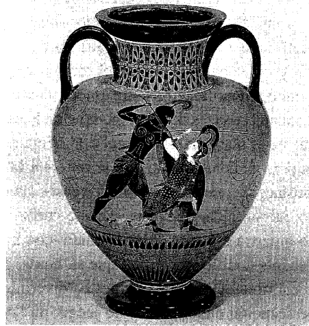
Lámina 5. Ánfora de figuras negras, firmada por Exequias (Londres, Museo Británico, B 210) (Foto: Osborne, Archaic and Classical Greek Art , Oxford, 1998, fig. 50).

La imagen del lécito de Búfalo nos pone, en cambio, frente a un tipo de escena amorosa un tanto extraña, en la que la participación del animal introduce un elemento nuevo que se interpone en la pareja; una escena –como vimos– sin paralelos, que se puede relacionar con el mundo salvaje y con la caza (ISLER-KERENYI 2001, p. 82), pero que, sin embargo,