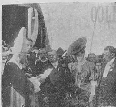
ACTO DE LA BENDICIÓN

comunicaros, Exmo. Sr. que en un día no lejano apadrinasteis el acto trascendental de la colocación de la piedra fundamental, en la seguridad de que vuestra alma ha de experimentar la intensa emoción que á todos los gallegos nos embarga.