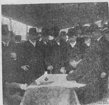
FIRMANDO EL ACTA

Al contemplar la grandeza de nuestro triunfo, su misma magnitud nos hará perseverar en la labor emprendida, con iguales entusiasmos; para que día á día nuestro progreso se agigante y la gloria pregone de confín á confín el nombre de Suevia, para que las generaciones la amen y bendigan.