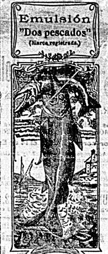
La que en menos tiempo alcanzó más popularidad y estimación de la clase media y obtuvo más medallas de oro.—Dr. Doyen.

en pública subasta un prado de verde y seco que mide 24 fedrados, poco más ó menos, sito en las Arceiras, parroquia de Santiago de Piagos, cuya subasta tendrá lugar el día 1.º de Enero próximo, de doce a dos de la tarde, en la casa del propietario de dicho prado, D. Manuel Lopez, del indicado lugar.