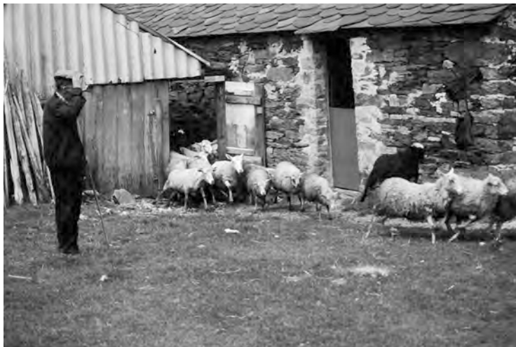
Foto 2: Alzada de Pandozarco. Sacando las ovejas al pasto. Año 1996.

época de actividad con tractores para cultivar y recoger la hierba; en cuanto a la ganadería sólo había una persona dedicada a este menester y tenía a su cuidado cien ovejas (Foto 2). Todos ellos subían y bajaban todos los días y nadie dormía en la alzada. Ya quedaba solamente una palloza en ruinas y el resto de las antiguas casas en su mayoría se habían convertido en almacenes relacionados con la actividad vinculada con la explotación de la hierba.