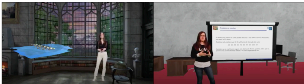
Figura 3: Captura de vídeos del uso de Cloudclass en la Universidad de Santiago de Compostela.