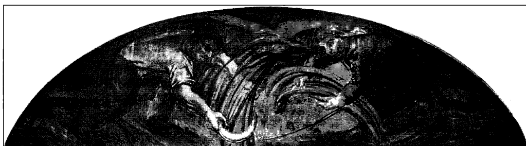
Fig. 6. Luneta.

poco tiempo decidió volver a la pintura figurativa en tanto ésta le permitía un anclaje directo en la realidad 23 .