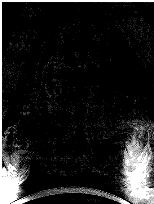
Fig. 4. Pechina izquierda.