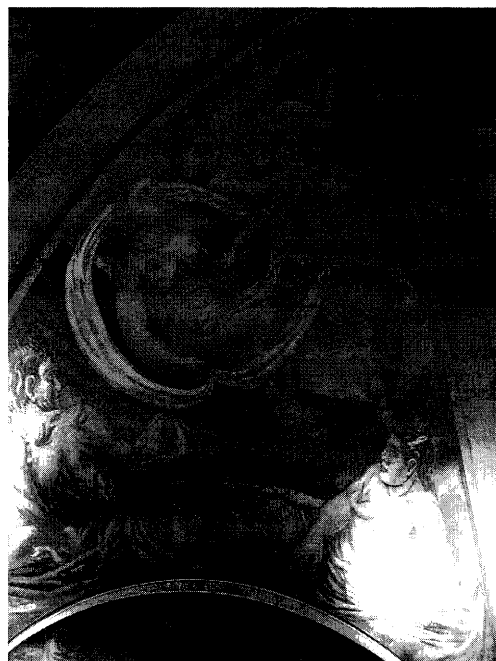
Fig. 5. Pechina derecha.