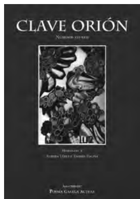
Exemplar da revista Clave Orión

Esta aposta pola interdisciplinabilidade artística continúa coa ilustración. Aquí apréciase unha notable diferenza con respecto á de Nordés : a aparición da cor. Ao longo da vida de Clave Orión son numerosos os nomes referidos como autores dos deseños que aparecen. Cómpre salientar que, nesta nómina reflectida, non se diferencia entre os debuxantes colaboradores habituais de Clave Orión e os autores cuxos deseños aparecen reproducidos na revista sen a implicación